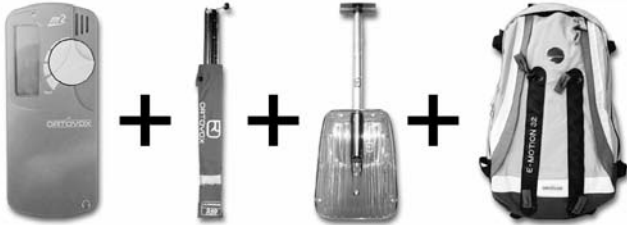
ORTOVOX "m2" analoges u. digitales LVS