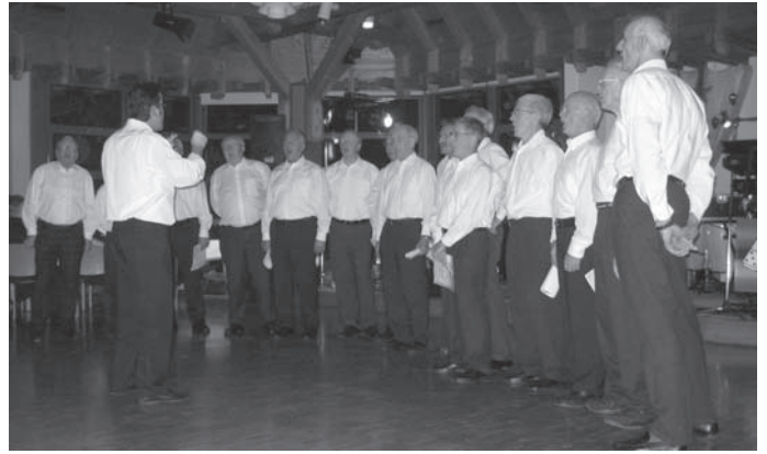
War dies wirklich der Abschiedsauftritt der Muffenjäger? All zu viele verstarben in den vergangenen Jahren und junge, sangesfreudige Freunde wurden (noch) nicht gefunden.

Aber wir wollen Besserung geloben und es nächstes Mal ganz sicher nicht vergessen. Merkt euch also schon mal einen Samstag Anfang Dezember vor. Bis dahin, Eure