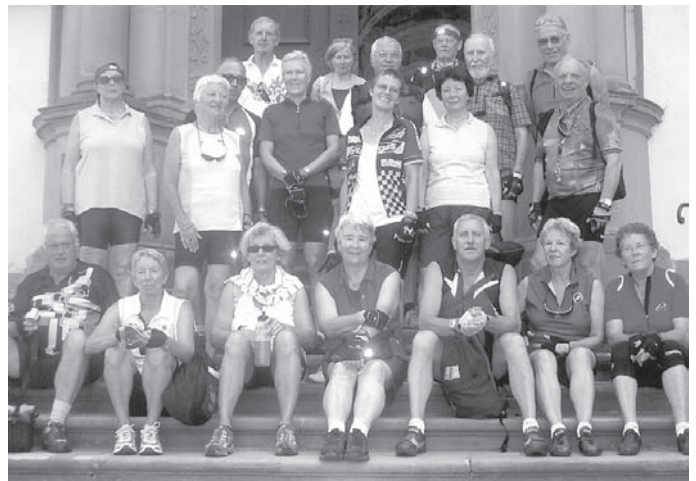
Die Teilnehmer der Tour 2006