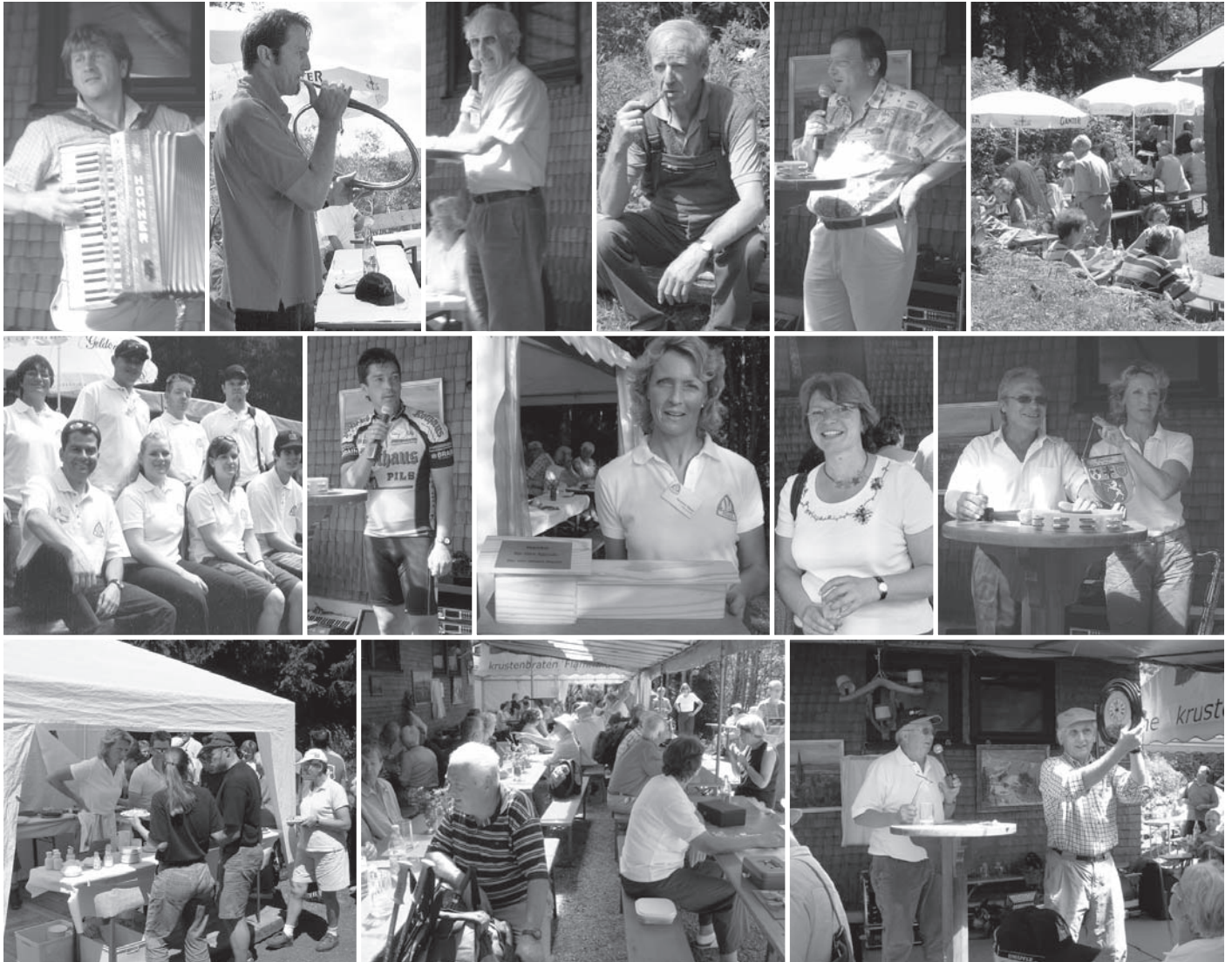
Hüttenfest 2006: Ideales Wetter, viele Besucher und super Stimmung.